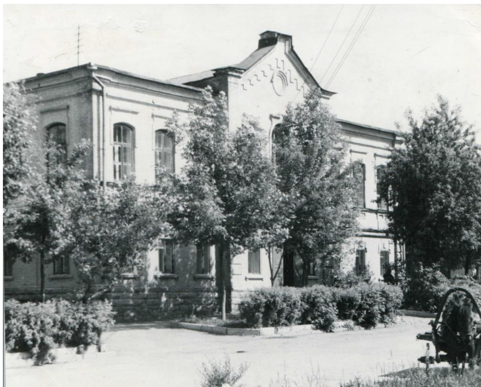
Общий вид здания Дома пионеров и школьников в г.Челябинске на ул. Карла Маркса, 1938